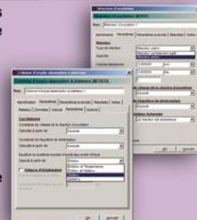
Fenêtres de configuration des opérations unitaires

De plus, ProSimPlus HNO 3 est un logiciel particulièrement ouvert qui permet aux utilisateurs d'y intégrer leur savoir-faire spécifique.