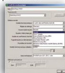
Sélection du profil thermodynamique